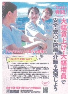
2023年春闘学習会資料

※資料内容①日本医労連2023春闘パンフ②23春闘学習会資料（医労連春闘方針、各種アンケート結果、2023年明和会の休日等について）